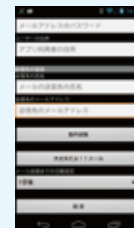
この画面が登録画面です